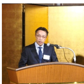
喜田情報委員長の立会再現