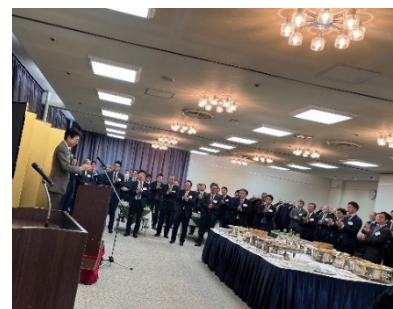
宇田川副理事長の油メ